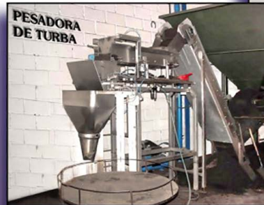
P - 10000