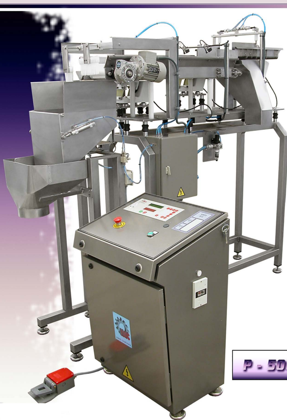
P - 5000