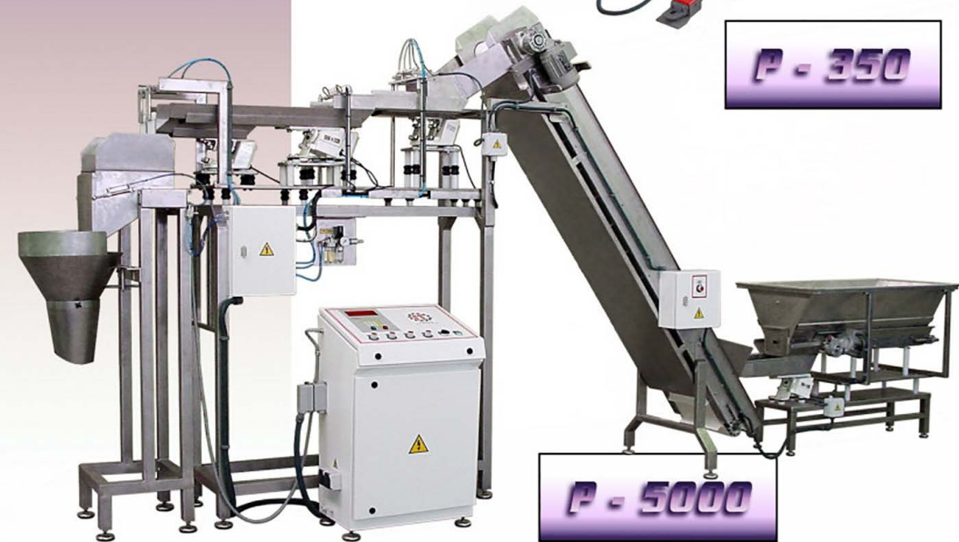
P - 350

Balcells Sustainable Development MAQUINARIA PARA LA INDUSTRIA ALIMENTARIA